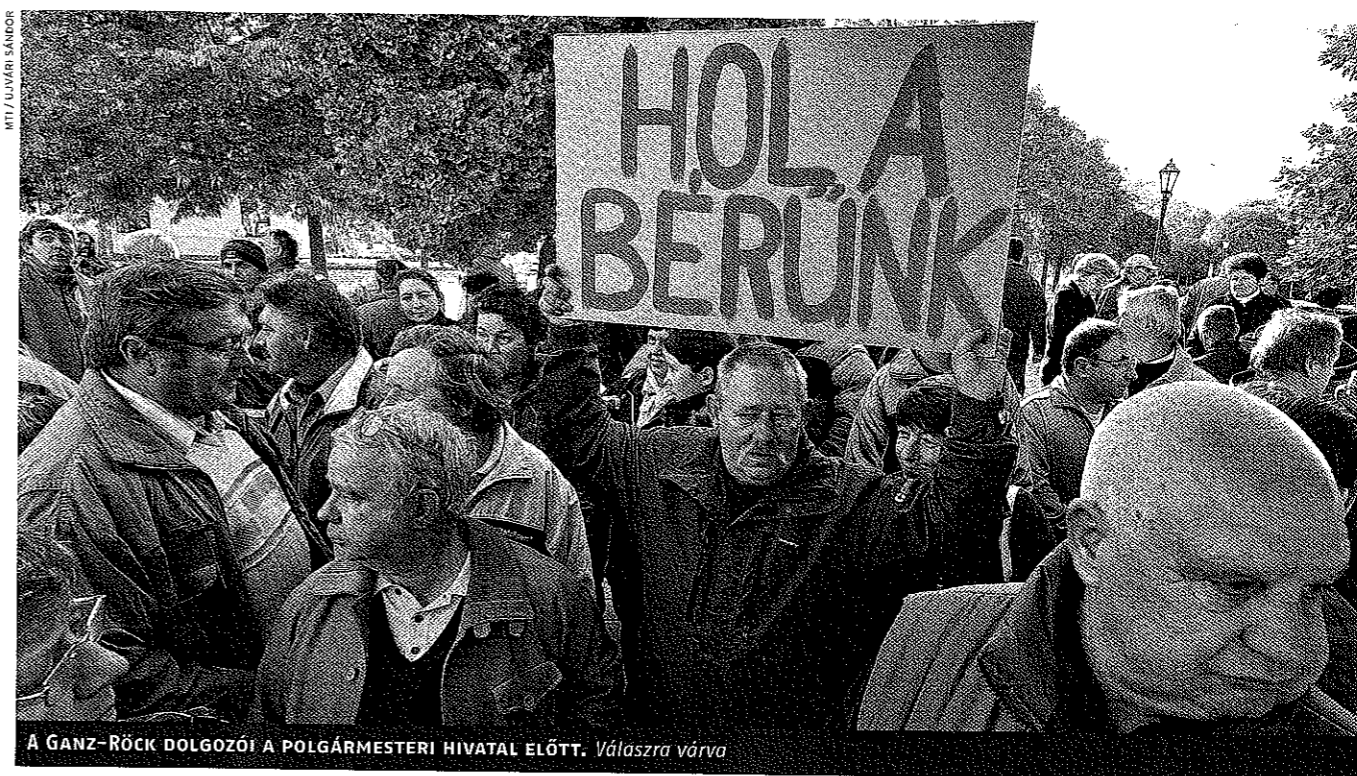
A GANZ-RÖCK DOLGOZÓI A POLGÁRMESTERI HIVATAL ELŐTT. Válaszra várva

Az Alstom cég árujának visszatartásával próbálja kicsikarni sztrájkkövetelése teljesítését a Ganz-Röck szakszervezete. Közben a bíróság elrendelte a cég felszámolását.